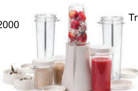
Мини блендер Tribest PB-250