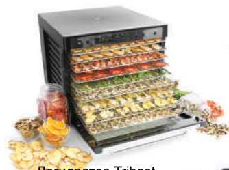
Дегидратор Tribest Sedona SD-P9150