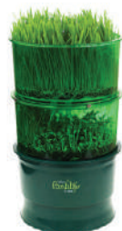
Пророщиватель Tribest FL-3000