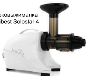
Соковыжималка Tribest Solostar 4