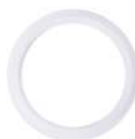
Силиконовое уплотнительное кольцо

Необходимо для создания герметичного соединения между стаканом и блоком ножей.